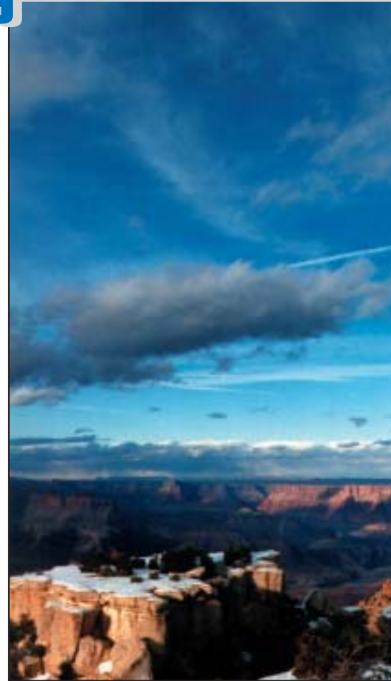
Grand Canyon im Februar

Wir kennen den Nordamerikanischen Kontinent von zahlreichen Reisen und über viele Jahre so gut, dass wir Ihnen sicherlich einen erlebnisreichen und interessanten Urlaub ausarbeiten können, wenn Sie uns nur Ihre „Grundvorstellungen“ nennen. Wir übernehmen natürlich nicht nur die reinen Reservierungsaufgaben für Sie, sondern vor allem die Aufgabe, Ihnen eine Reisedokumentation zusammenzustellen, die an vollständigen Informationen, Kartenmaterial, Streckenbeschreibungen und Ausflugstipps kaum einen Wunsch offen lässt. Und natürlich mit Hinweisen und Angaben darüber, wie Sie Ihre Unterkunft am besten finden können.