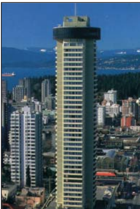
das Landmark Hotel in Vancouver

imr Reisen imr Reisen Dahlienstr. 20 47495 Rheinberg