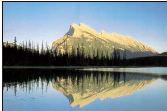
Mount Rundel, Alberta

In der Heutige Zeit, mit E-mails kommt es häufiger vor das Kunden die gleiche anfrage an mehreren Veranstalter schicken um das beste Angebot heraus zu suchen. Wir begrüßen diese entwicklung weil wir überzeugt sind von unsere Leistungen und freuen uns über jede Möglichkeit unserm Programm zu Präsentieren. Andererseits möchten wir unsere Kapazitäten für unsere Kunden einsetzen und nicht jede nachfrage hinterher rennen. Wir wissen auch das sich jeder Freuen würde einen kostenloser Reiseführer über seine individuelle Reise zu bekommen; auch wenn die Leistungen schon bei ein unserer Mitbewerber gebucht sind. Wir haben uns entschlossen eine bescheidene Gebühr von EURO 50,- zu berechnen für jeden Detailliertes Reisebericht den wir zusammenstellen. Dieses gebühr wird selbstverständlich mit eine Buchung verrechnet.