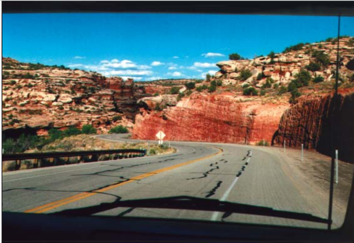
auf dem Weg von Canyonlands Nationalpark nach Moab.

unsere auserwählte Hotels stellen; ob Touristenklasse, 3-4 Stern oder First Class. Auch wenn Sie uns nur einige Eckdaten geben werden wir Ihre persönliche Reise ausarbeiten. Um Ihnen einen Flugangebot zu machen bräuchten wir den Abflughafen den Ihnen am liebsten wäre.